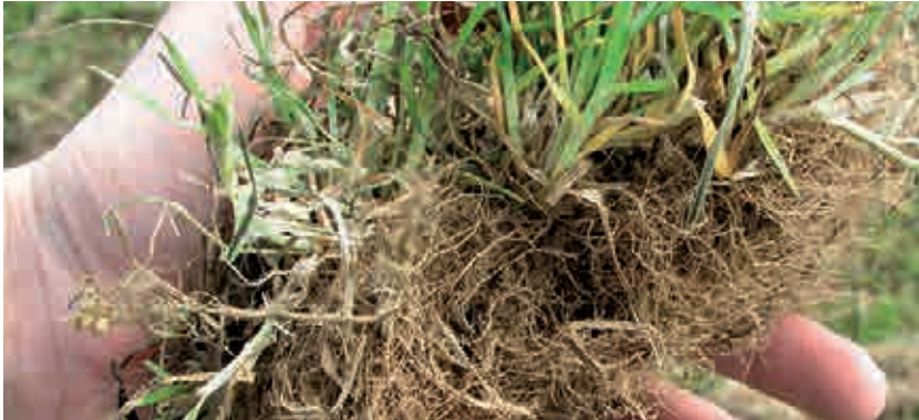
... et le pâturin commun