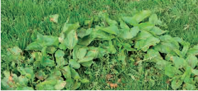
Particulièrement redoutés : Les polygonacées ...