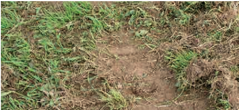
Défauts de repousse d'herbe après années sèches